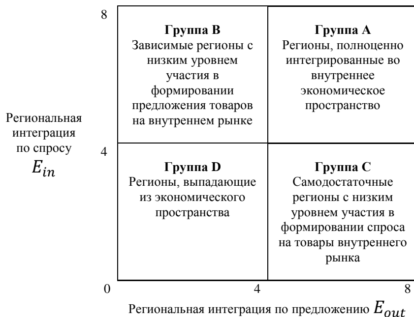
Рисунок 2 – Классификационные группы регионов по уровню интеграции в экономическое пространство страны

Необходимо подчеркнуть, что принадлежность региона к выпадающим из экономического пространства может иметь место в том случае, если сеть их торговых отношений географически не диверсифицирована, а объем товарных потоков с отдельными регионами имеет низкую значимость для ВРП.